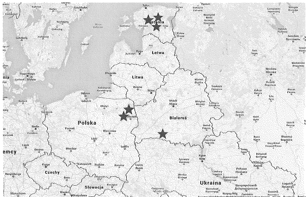
Ryc. 2. Pochodzenie orlików grubodziobych stwierdzonych na Ziemi Łódzkiej w latach 2000–2015

Orlik grubodzioby stwierdzany był na Ziemi Łódzkiej bardzo rzadko. W latach 2000–2015 odnotowano ten gatunek 10 razy. W każdym przypadku były to pojedyncze osobniki. Fenolo-